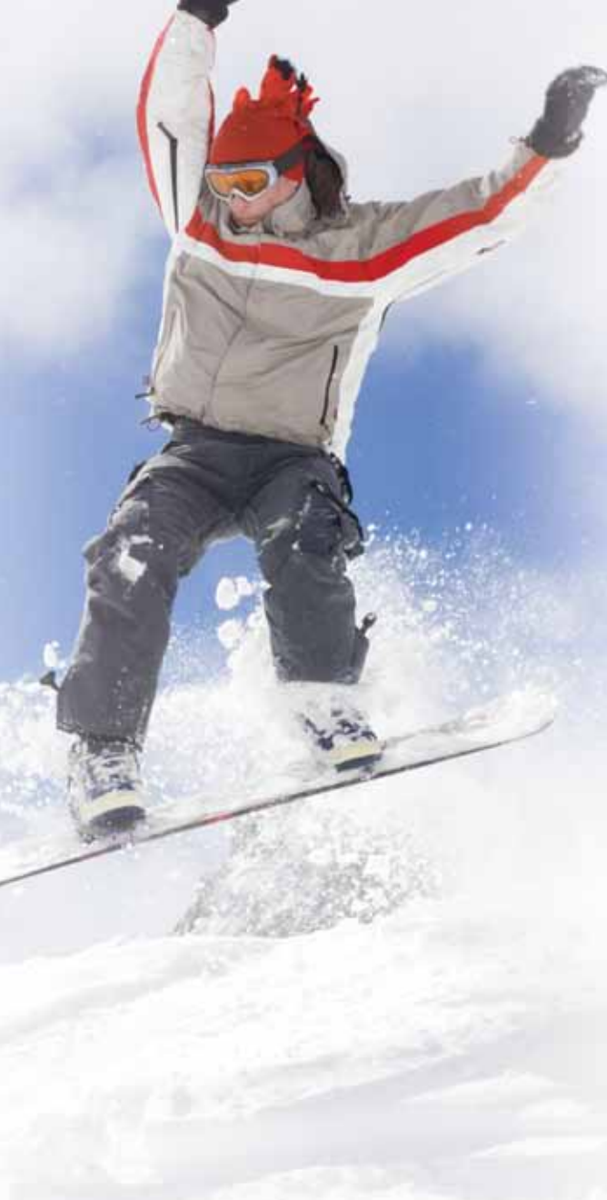
オタワには1年を通して、生徒が満喫できる楽しみが数多くあります！