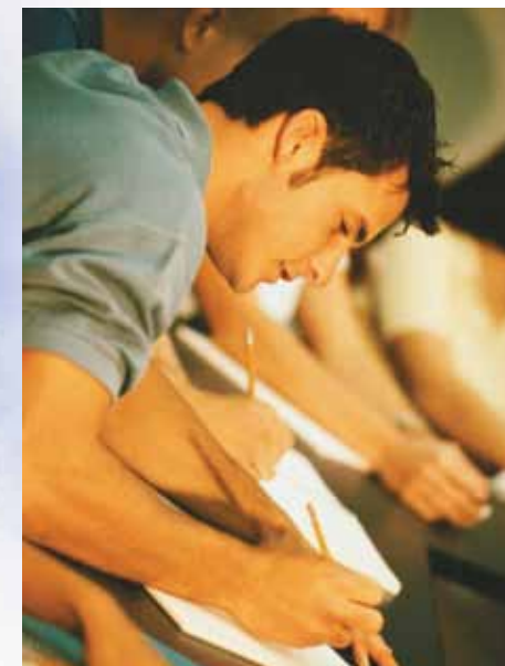
OCDSBで就学する留学生は、それぞれの興味や学業の目標に沿った進路を選ぶことができます。