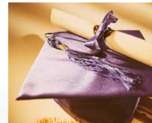
OCDSBの学生はカナダ全域および世界中の大学で優秀な成績を収めています。